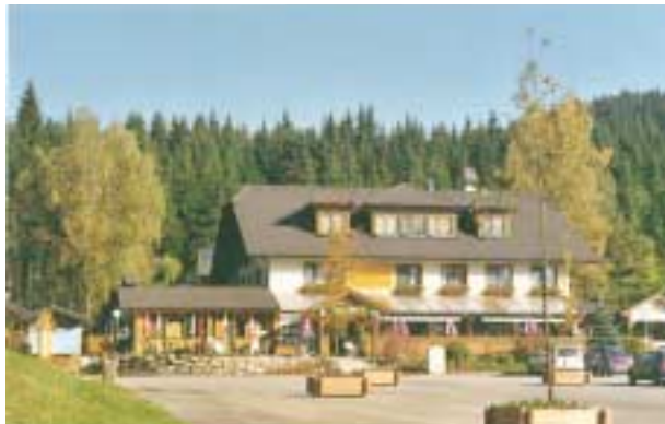
Saftige Umsatzsteigerungen gab es für den Sternsteinhof der Familie Riepl in Bad Leonfelden-Oberlaimbach durch die Umsetzung des EnergyManagement-Konzepts von Qi-Balance

Plätzen befinden, TV-Apparate so platziert werden, dass sie mit der Gehäuserückseite nicht direkt an der Wand stehen, wo sich im nächsten Zimmer der Kopfteil des Gästebettes befindet. Kunstfasern sind zu meiden, um die elektrostatische Aufladung gering zu halten.